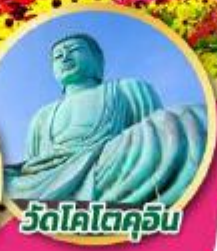
วัดโคโตะคุอิน