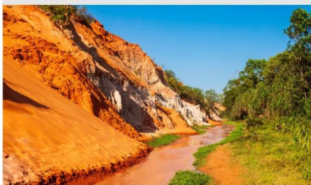
ลำธารนางฟ้า