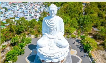
วัดลองเซิน