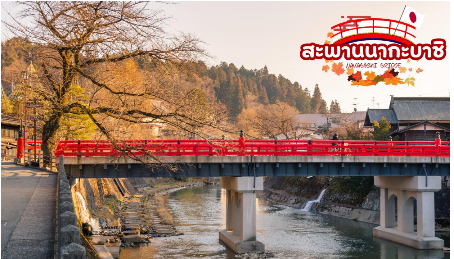
สะพานนาคะบาชิ (Nakabashi Bridge) สะพานสีแดงของย่านเมืองเก่า สะพานทอดข้ามแม่น้ำมิกากาวะ ที่ไหลผ่านใจกลางเมือง สะพานแห่งนี้ถือเป็นสัญลักษณ์ของเมืองทาคายามา