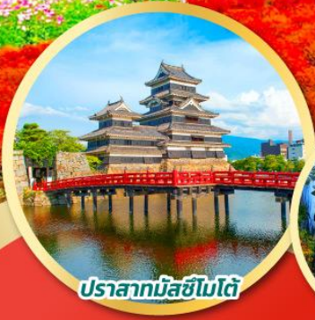
ปราสาทมิสึชิมิได