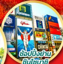
ช้อปปิ้งย่าน ชินจูกุ