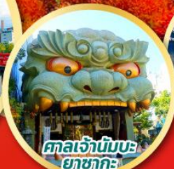
ศาลเจ้านันบะ ยาซากะ