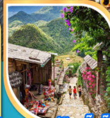
หมู่บ้านกัตกัต