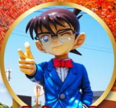
โคนินทาวน์