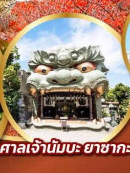
ศาลเจ้านิมบะ ยาชากะ