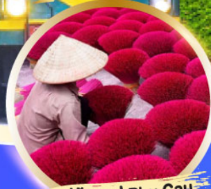
หมู่บ้านรูป Phu Cau