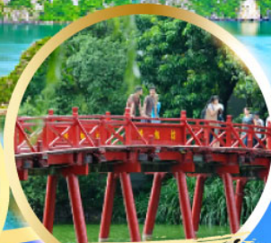
สะพานแสงอาทิตย์