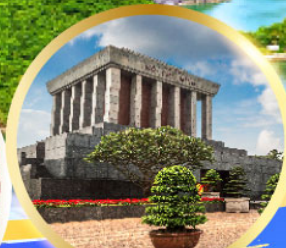
สุสานลุงโฮ