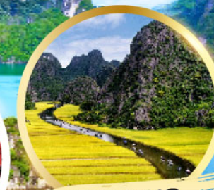
ฮาลองบัก