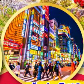
ช้อปปิ้ง ย่านชินจูกุ