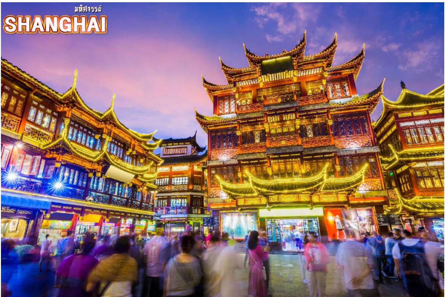
จากนั้น ชมบรรยากาศของ ตลาดร้อยปีเจินหวังเมี่ยว ตลาดที่เก่าแก่ของเมืองเซี่ยงไฮ้ อาคารบ้านเรือนบริเวณนี้ มีสไตล์สถาปัตยกรรมแบบจีนโบราณที่ยังคงความงดงามเอาไว้ ทั้งร้านขายอาหาร ร้าน