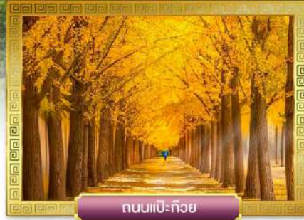
ถนนแปะก๊วย