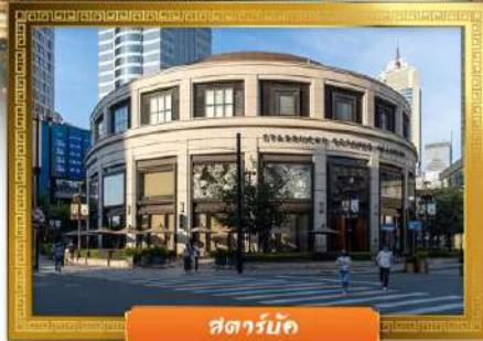
สตาร์บัค