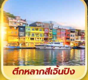
ตึกหลากสีเจินปิง