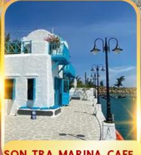
SON TRA MARINA CAFE