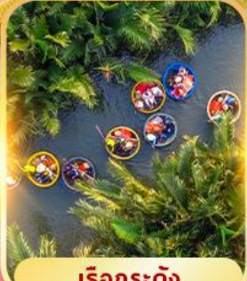
เรือกระดิง