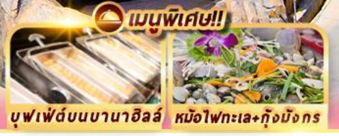
บุฟเฟ่ต์บนบานาฮิลล์ หม้อไฟทะเล+กุ้งมังกร