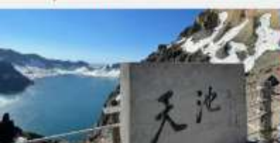
อุทยานจางไป่ซาน