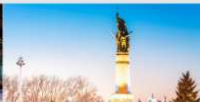
อนุสาวรีย์ผึ้งหง