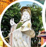
เจ้าแม่กวนอิม ธิพัลส์ เบย์