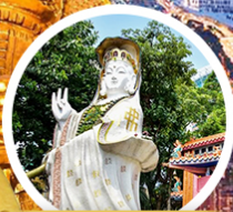
เจ้าแม่ทวนอ้น รฟลสั เบย์