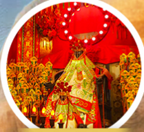
เจ้าแม่ทวนอ้นฮ่องกง