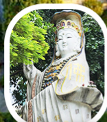
เจ้าแม่กวนอิม รัฟลีส เบย์