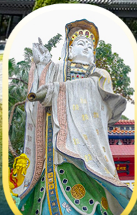
วัดเจ้าแม่กวนอิมรี พลัสเบย์