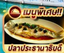
เมนูพิเศษ!! ปลาประธาราธิบดี