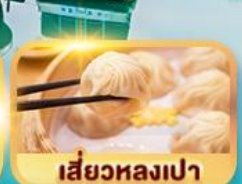
เสี่ยวหลงเปา