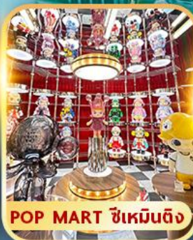
POP MART ซีเหมินติง