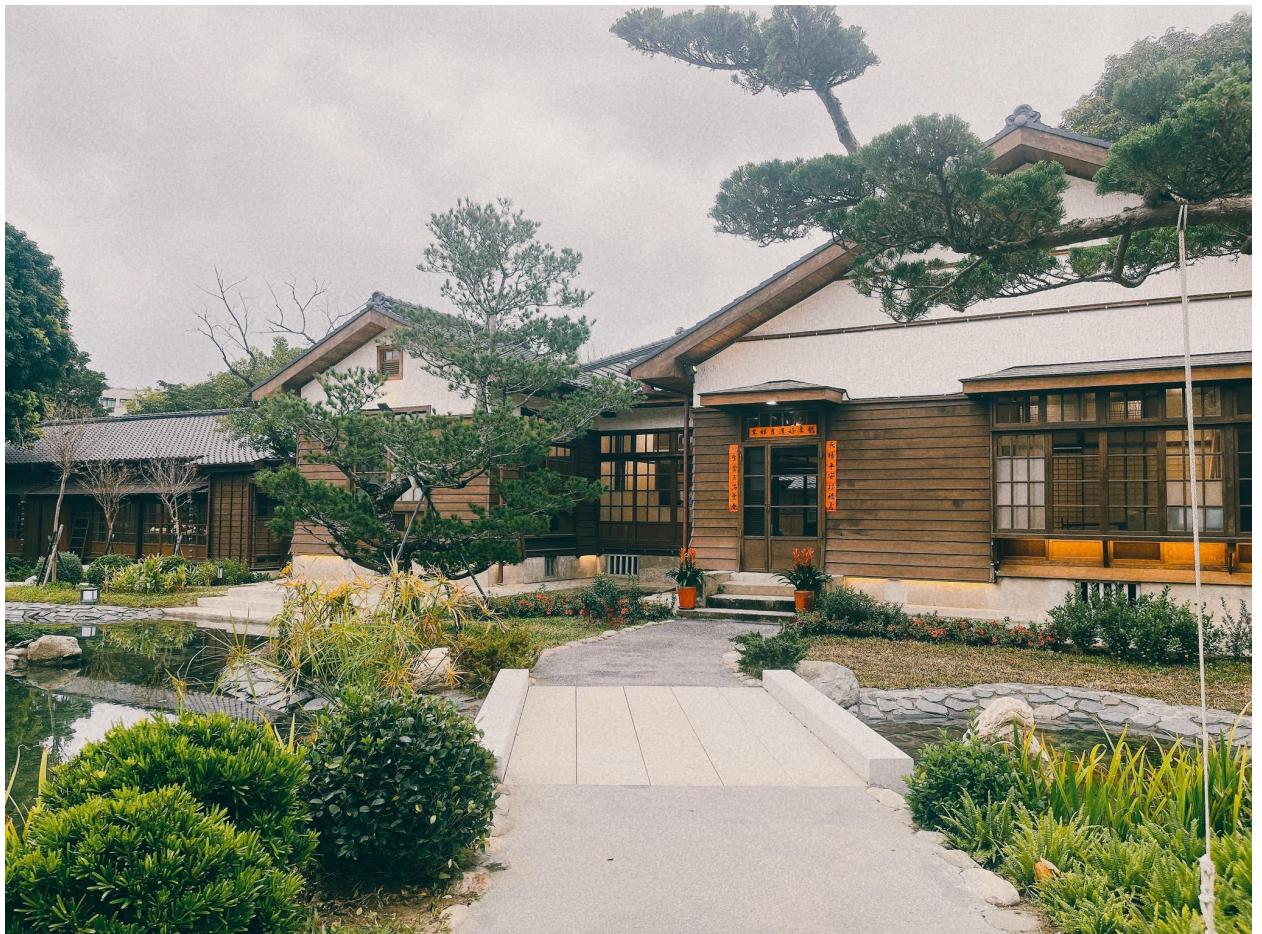
ภายในหมู่บ้าน และเดินเก็บภาพบรรยากาศเยี่ยมชมตามอัธยาศัย

Meilun ตั้งอยู่ติดกับสะพาน Zhongzheng ในเมืองฮวาเหลียน ซึ่งเป็นพื้นที่หมู่บ้านไม้สไตล์ญี่ปุ่นที่จัดตั้งขึ้นระหว่างการยึดครองของญี่ปุ่น และยังคงเป็นที่พักของเจ้าหน้าที่ญี่ปุ่นที่ประจำการอยู่ในฮวาเหลียน สวนแห่งนี้สร้างจากไม้ไซเปรส และนอกจากสไตล์ญี่ปุ่นแล้ว ยังผสมผสานสไตล์ท้องถิ่นและยุโรปเข้าไว้ด้วยกัน และเคยเป็นที่พำนักอย่างเป็นทางการของ Nakamura Daisa Nakamura Osa เป็นผู้บัญชาการทหารในพื้นที่ฮัวเหลียนระหว่างการยึดครองของญี่ปุ่นพวกเขาจึงเรียกสถานที่นี้ว่า "คฤหาสน์ของนายพล"ให้ท่านได้สัมผัสบรรยากาศ