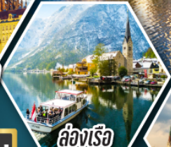
ล่องเรือ ทะเลสาบอัลสติก