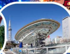
ช้อปปิ้งชากาเอะ