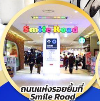
ถนนแห่งรอยยิ้มที่ Smile Road