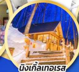
นิงเกิ้ลเทอเรส