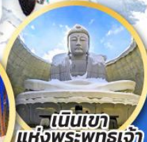
เป็นเขา แห่งพระพุทธรเจ้า