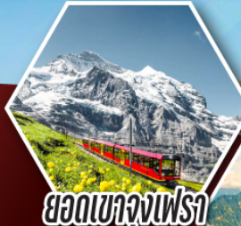
ยอดเขาจุงเฟรา