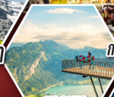
ยอดเขา ฮาร์เตอร์คูลุม