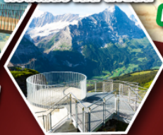
ยอดเขา กรินเดลวาลด์ เพียสตี