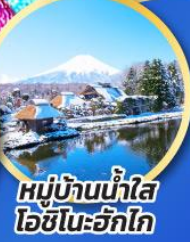
หมู่บ้านน้ำใส โอชิโนะฮักไก