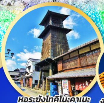
หอรบั้งโตคิโนะคาเนะ