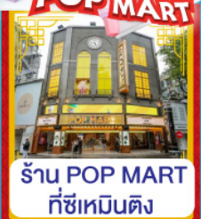
ร้าน POP MART ที่ซีเหมินติง