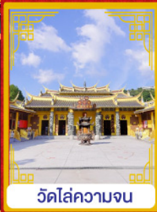
วัดไล่ความจน