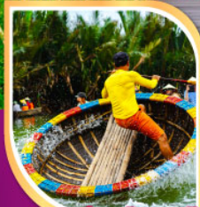
ล่องเรือกระดิง