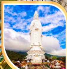
วัดลินห์ฮื่อง