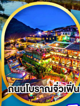
ถนนโบราณจิวเฟิ่น