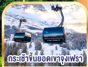
กระเช้าขึ้นยอดเขาจุงเฟรา