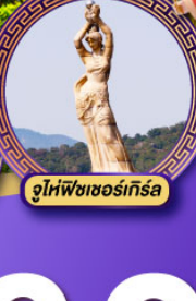
จูไห่พีชเชอร์เกิร์ล