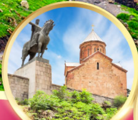
โบสถ์เมตคี