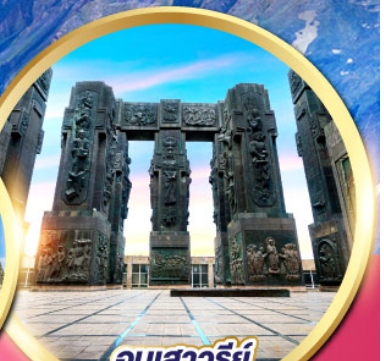
อนุสาวรีย์ ประวัติศาสตร์จอร์เจีย