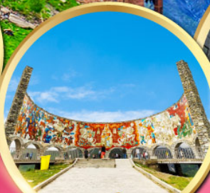
อนุสรณ์สถาน รัสเซีย-จอร์เจีย