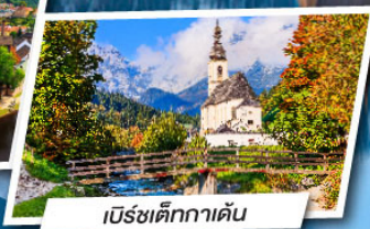
เบิร์ชเต็กกาเดิน