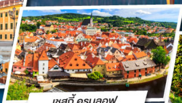
เซสท์ ครุมลอฟ