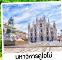
มหาวิหารคูโอโม

18-24 ก.ย. 67 09-15 ต.ค. 67 09-15, 18-24 พ.ย. 67