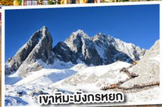
ภูเขาหิมะมิงกรหยก