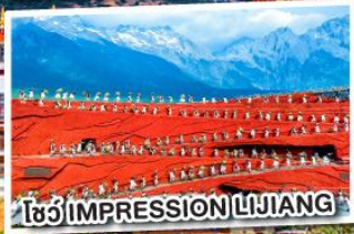
ชมโชว์ IMPRESSION LIJIANG