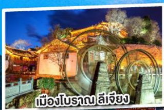
เมืองโบราณ ลี้เจียง

ฟรี ประกัน สุขภาพ และอุบัติเหตุ กับ ไทยวุ้นนีน GTIP Plus (Gold Plan) 3 ล้านบาท คุ้มครองสูงสุด *เงื่อนไขขึ้นอยู่กับบริษัทประกันภัย ความคุ้มครองนี้หมายถึงผลประโยชน์