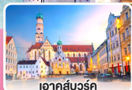
เอาคส์บวร์ค