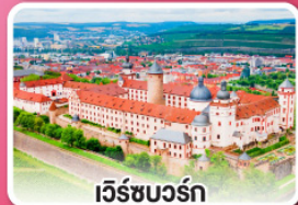
เวิร์ชบวร์ค