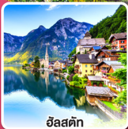
ฮัลสตัดท์

เกี่ยวกับครบเส้นทาง สายโรแมนติก เยอรมัน จากเวิร์ชบวร์คสู่เอาคส์บวร์ค