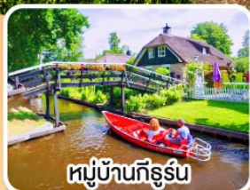
หมู่บ้านกังหัน