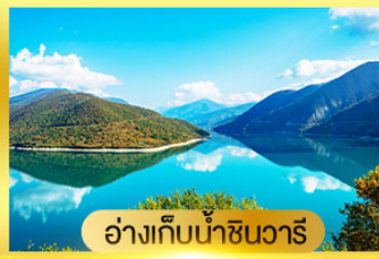
อ่างเก็บน้ำชินวาริ