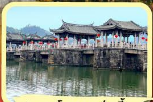
• สะพานโบราณกว่างจี