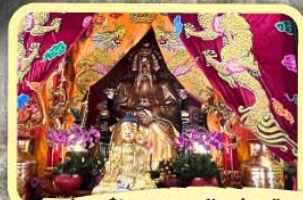
• เอียงบูซิว (ศาลเจ้าพ่อเสือ)