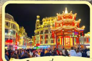
• ถนนโบราณเสี่ยวกงหยวน