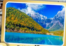
ทะเลสาบไป๋สฺยฺเหอ