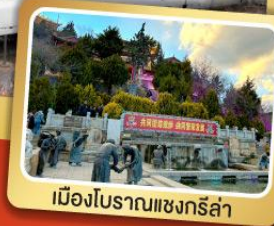
เมืองโบราณแชนกรีล่า