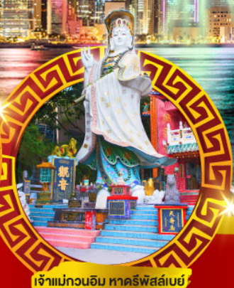
เจ้าแม่กวนอิม ทาครีฟส์ลีย์