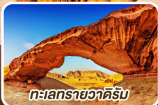
ทะเลทรายวาดีรัม