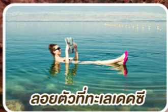
ลอยตัวที่ทะเลเดดซี