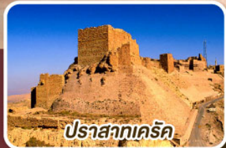
ปราสาทเคิร์ค