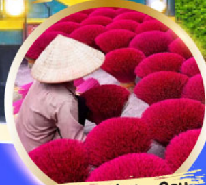
หมู่บ้านรูป Phu Cau