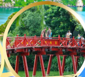
สะพานแสงอาทิตย์