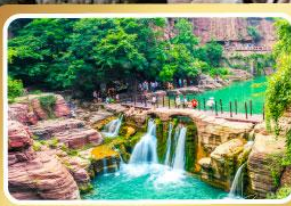
อุทยานหยุ่นโกซ่าน