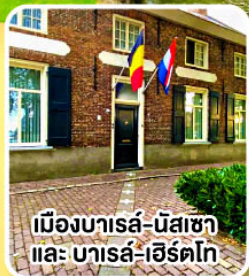
เมืองบารส์-นัสซา และ บารส์-เฮิร์ตโก