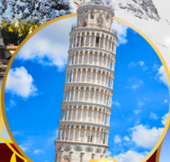
หออนปีซ่า