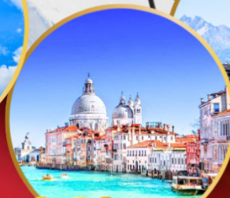
ล่องเรือสู่เกาะเวนิส