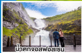
น้ำตกจอสฟอสเซน