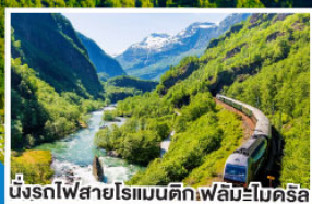
นั่งรถไฟสายโรแมนติกฟิล์มโบโรครี