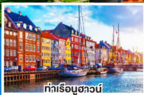
ท่าเรือชวอนี