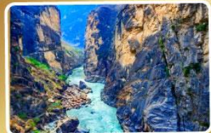
ช่องแคบเสีงเถะโถน