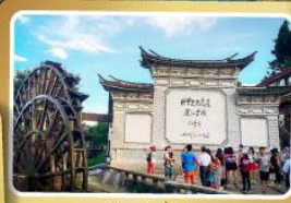
เมืองกำลังเจียง