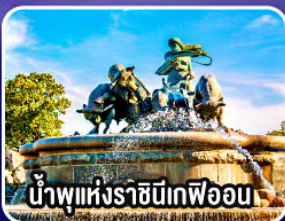
น้ำพุแห่งราชินีเกฟออน