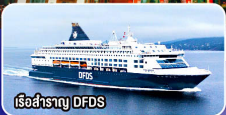
เรือสำราญ DFDS