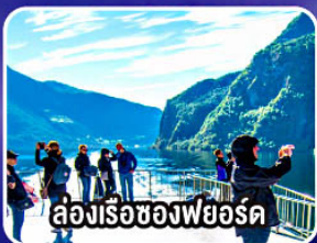
ล่องเรือช่องฟยอร์ด