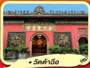
• วัดต้าเฉียว