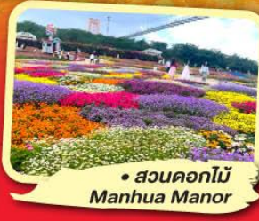
• สวนดอกไม้ Manhua Manor

ไม่ลงร้านซื้อ พักโรงแรม 4-5 ดาว ชมโชว์ริเบต โชว์เปลี่ยนหน้ากาก